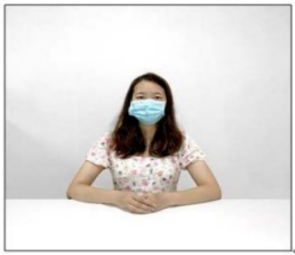
图2：正前方第一机位效果图。