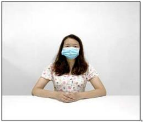
图2：正前方第一机位效果图。