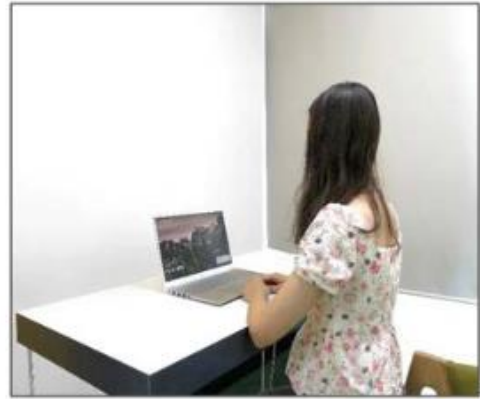
图3：侧后方第二机位效果图。

第二机位设备仅用于监控考试环境。请务必保证第二机位设备不会对面试造成干扰。如使用手机作为第二机位，应保证面试不被来电打断，须提前办理呼叫转移或免打扰。因手机使用造成掉线或者影响面试效果，后果由考生自行承担。